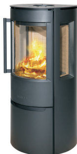
WIKING Luma 3