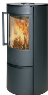
WIKING Luma 4