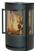
WIKING Luma 1