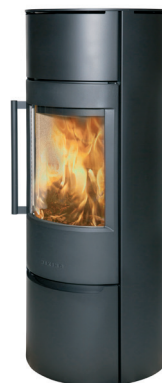
WIKING Luma 6