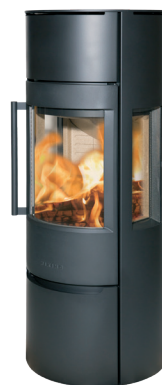
WIKING Luma 5