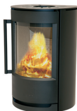
WIKING Luma 2